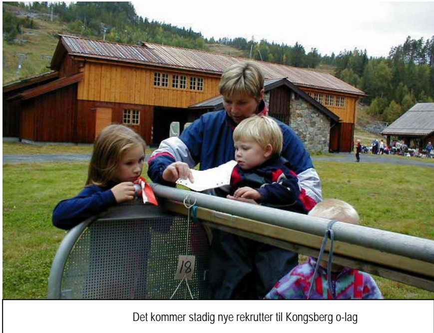
Det kommer stadig nye rekrutter til Kongsberg o-lag

Oppsummering/betraktninger sesongen 2000 fra rekrutt-utvalget